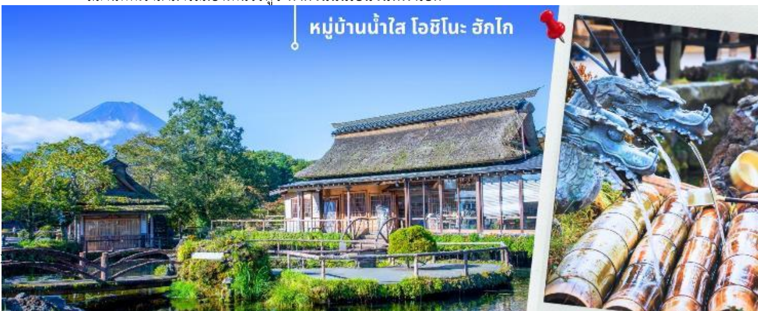
หมู่บ้านน้ำใส โอชิโนะ ฮักไก

หลังรับประทานอาหารเที่ยง นำท่านเดินทางสู่ หมู่บ้านน้ำใส โอชิโนะ ฮักไก (Oshino hakkai) ถือเป็นหมู่บ้านแห่งการท่องเที่ยวที่ยังคงความอุดมสมบูรณ์ของธรรมชาติเอาไว้ได้อย่างดีในหมู่บ้านมีบ่อน้ำใสที่เป็นน้ำที่ละลายมาจากหิมะบนภูเขาไฟฟูจิ ที่นี้มีความสวยงามในระดับที่ว่าได้รับการขึ้นทะเบียนให้เป็นมรดกทางธรรมชาติ ในปี ค.ศ. 1934 และได้รับคัดเลือกให้เป็นหนึ่งในภูมิทัศน์ทางน้ำที่งดงามในปีค.ศ. 1985 อีกด้วย ไฮไลท์ในช่วงฤดูหนาว เราจะสามารถเห็นบรรยากาศหมู่บ้านที่ปกคลุมไปด้วยหิมะ ทั่วบริเวณ ให้ความสวยงามและความโรแมนติกไปอีกแบบ ทั้งยังเป็นอีกหนึ่งสถานที่ที่เราสามารถมองเห็นวิวฟูจิ หากวันนั้นเป็นวันที่ฟ้าเปิด