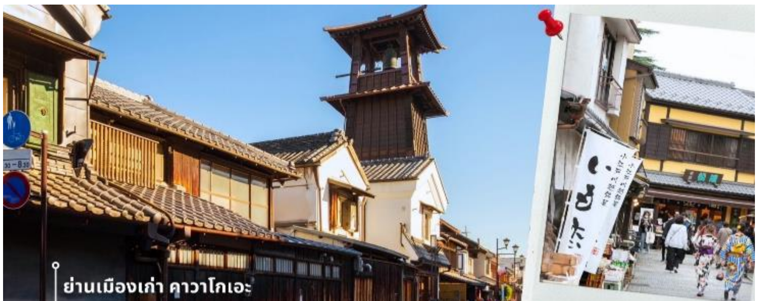
CXJNRT19 ฮาคุยะ คามิโคจิ พูจิ อิสระซ้อปปี้งโตเกียว 6วัน4คืน (MAY-JUN26)

08.00 น. เดินทางถึงสนามบินนาริตะ ประเทศญี่ปุ่น หลังจากผ่านพิธีตรวจคนเข้าเมืองและศุลกากรแล้ว นำท่านขึ้นรถโค้ชปรับ อากาศ พาท่านเดินทางสู่ นำท่านเดินทางสู่ ย่านเมืองเก่าคาวาโกเอะ เมืองเก่าที่ได้รับสมญานามว่า “เอโดะน้อย” ด้วยความโดดเด่นของอาคารสไตล์แบบญี่ปุ่นดั้งเดิม ที่เรียงรายสองฝั่งถนนอย่างมีเสน่ห์ ราวกับได้ย้อนเวลากลับไปใน ยุคเอโดะ ใจกลางเมืองแห่งนี้คือ ถนนคุระซุกุริ Kurazukuri-dori ที่เต็มไปด้วยร้านค้าท้องถิ่น คาเฟ่ขนมหวาน และ ของฝากสไตล์ญี่ปุ่นโบราณ การเดินเล่นที่นี่ไม่ใช่แค่การเที่ยวชมสถาปัตยกรรม แต่ยังสามารถชิมซึบบรรยากาศที่เงียบสงบ มี เสน่ห์เฉพาะตัว เหมาะสำหรับการถ่ายรูปและเรียนรู้วัฒนธรรมญี่ปุ่นในแบบที่จับต้องได้ สัญลักษณ์สำคัญของเมืองคือ “หอรระซังโทคิโนะคานะ” (Toki no Kane) ที่ยังคงดังบอกเวลาวันละ 4 ครั้ง เป็นเสียงแห่งอดีตที่ยังสะท้อนอยู่ใน